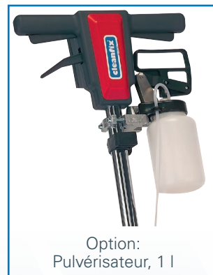
Option: Pulvérisateur, 1 l