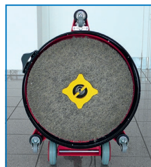
Machine avec plateau d'entraînement intégré