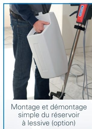
Montage et démontage simple du réservoir à lessive (option)