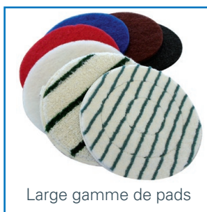
Large gamme de pads