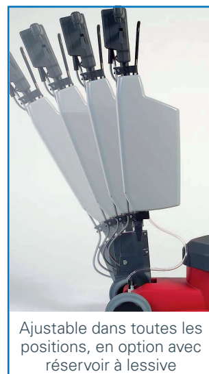
Ajustable dans toutes les positions, en option avec réservoir à lessive