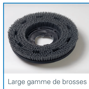
Large gamme de brosses